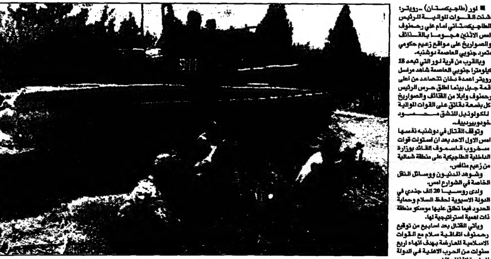
قوات مروحية الرئيس الطاجيكي امام رحمانوف تصعد مواقع قائد متمرد قرب دوشنبه (روسيا)